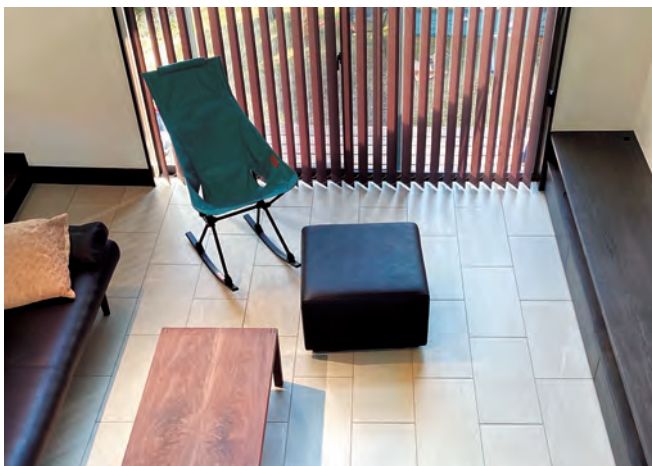
床暖房 施工例 原克久様邸 「ランドストーン」CRD-U3810 (P.550)